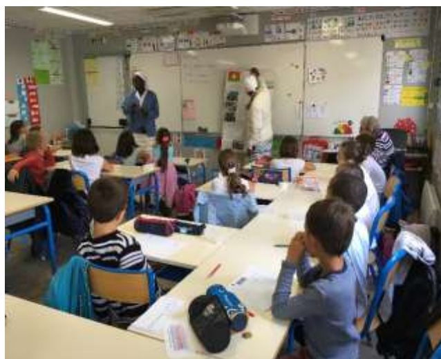
Echanges à l'école de Varades