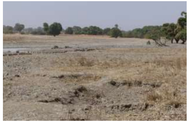
Au village de Ténado, le lit du fleuve est à sec

Une action solidaire « ponctuelle » sera nécessaire, tous ensemble, nous saurons y répondre.