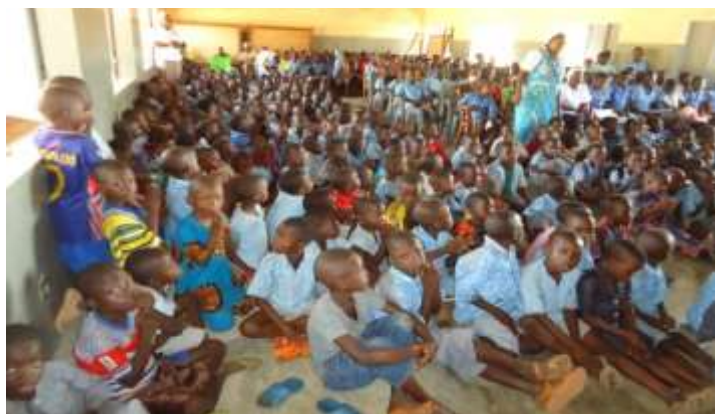
Le jour de la Messe d'entrée dans la grande salle

*Auditeurs libres : Enfants n'ayant pas l'âge requis, mais qui sur l'insistance des parents assistent aux cours dans l'attente de la rentrée suivante.