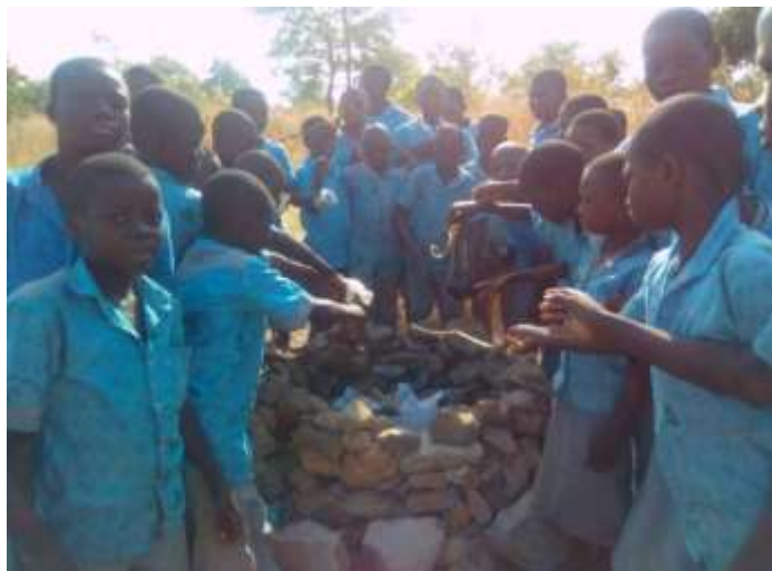
La poubelle construite par les élèves pour brûler les ordures

Voilà en quelques mots ce que nous pouvons partager avec vous pour le moment. Merci pour l'intérêt que vous portez sur cette structure, merci pour tout. »